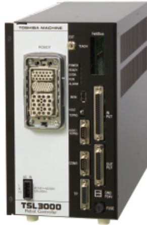
◀ Robot Controller TSL3000