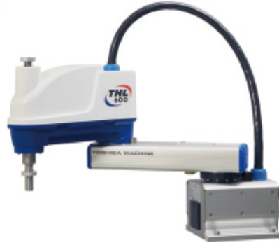
◀ Scara Robot THL600