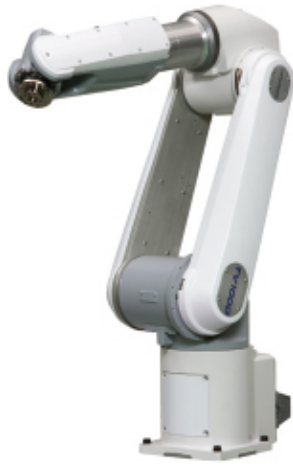
▲ 6 Axis TV1000